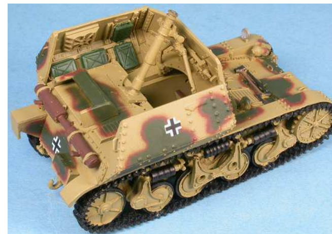
GAS50173K Mortier de 80 mm Mod. 34 sur AMR (f)

Ce modèle est fabriqué par Quarter Kit Modèle Shop 10, passage du charolais 75012 Paris France Tél./Phone: (33) 01.44.75.01.61 Fax: (33) 01.44.75.01.16 E-mail: info@quarter-kit.com Web site: www.quarter-kit.com