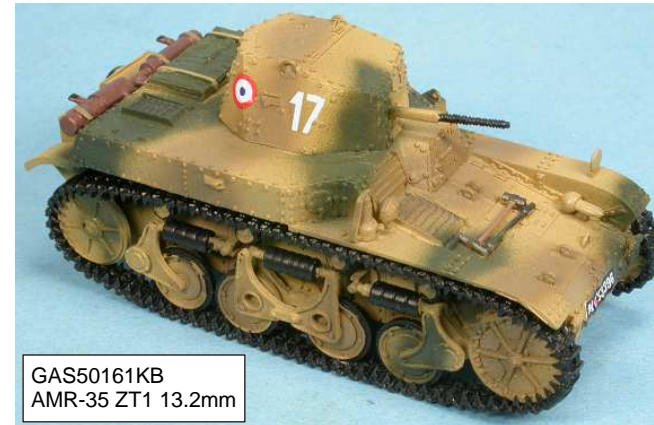
GAS50161KB AMR-35 ZT1 13.2mm

These AMR 35s showed their excellent mobility features during the brief French campaign that ended Saturday, June 22 1940. Afterwards the remaining vehicles have been seized and used by the German forces.